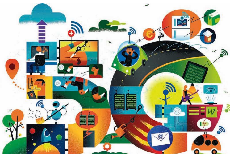
ILUSTRAÇÃO PAULO BUCHINHO

Concurso da quinta geração móvel, que promete revolucionar a economia, continua marcado pela polémica. Governo assegura que não irá tirar poder ao regulador E10